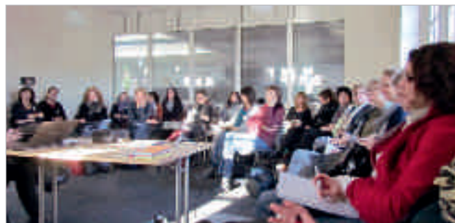
Fachtag »Zugänge schaffen, Lücken schließen«, 26.11.2013

Alle Bezirke beteiligen sich an der Bundesinitiative. Beim Aufbau des Netzwerks soll eine umfassende Beteiligung des Gesundheitswesens erreicht werden. Schon bei der Entwicklung der Förderkonzepte erfolgte eine intensive Zusammenarbeit von Jugendamt und KJGD, der durch die Willkommensbesuche einen Überblick über die Bedarfe belasteter Familien hat. Die Netzwerkkoordination ist beim Jugendamt angesiedelt und bezieht den KJGD regelhaft mit ein. Schwangerschaftsberatungsstellen, Zentren für Familienberatung und sexuelle Gesundheit sowie Geburtskliniken sind schon in die Netzwerke einbezogen, Fachveranstaltungen mit Kliniken und niedergelassenen Fachärztinnen und -ärzten sind geplant.