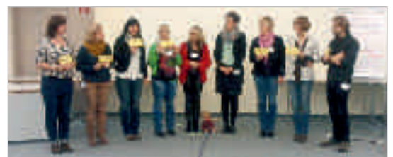
Qualifizierungsworkshop der Netzwerkkoordinatorinnen

Der QZ der Familienhebammen (FamHeb) und Familien-Gesundheits- und Kinderkrankenpflegerinnen und -pflegern (FGKiKP), bestehend aus Vertre-